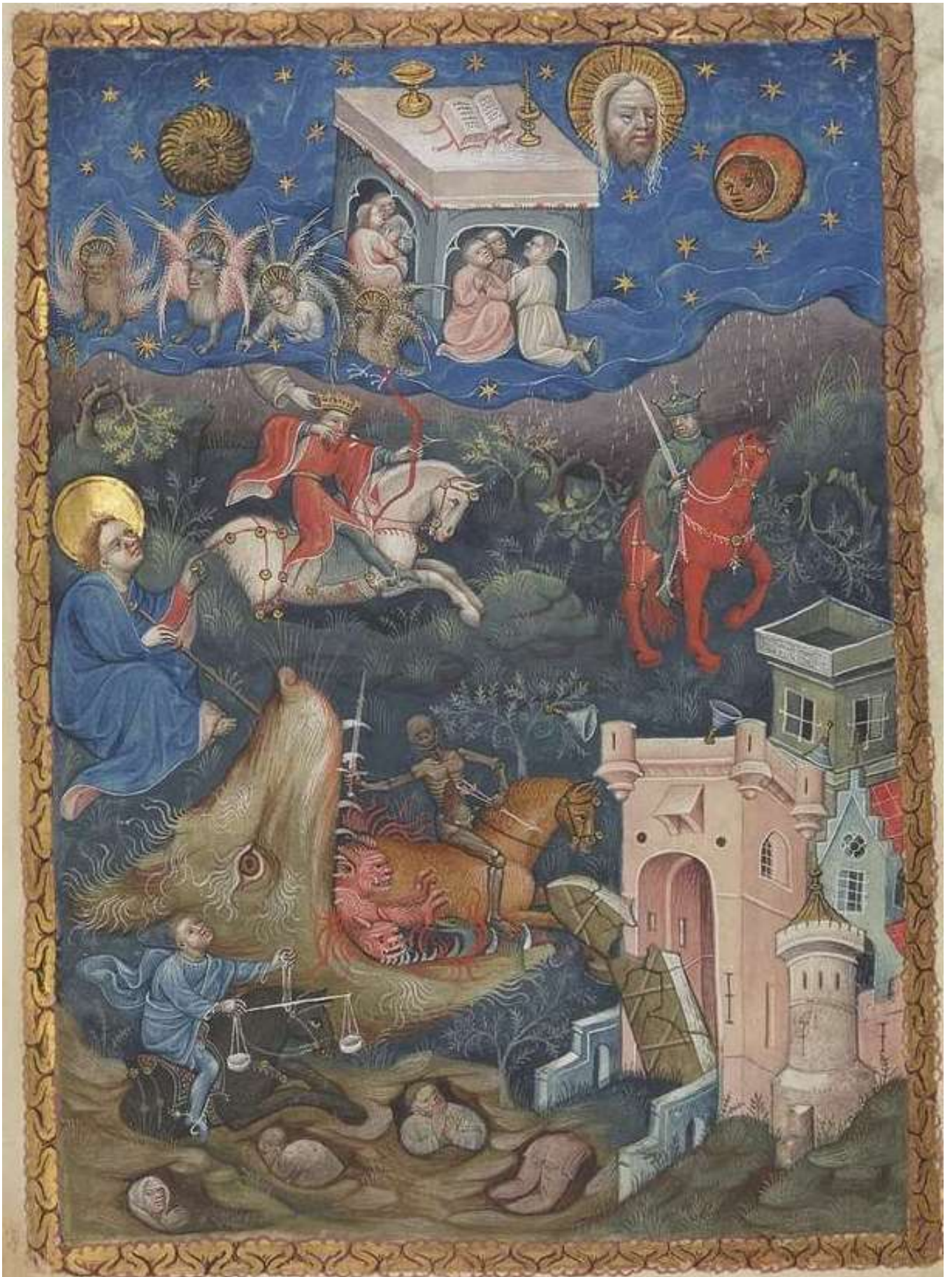
L' Apocalypse dite flamande (Ap 6) manuscrit enluminé contenant l'Apocalypse de Jean, écrit et peint au début du XV ème siècle. Bibliothèque nationale de France à Paris